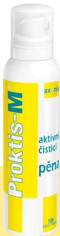
Zdravotnický prostředek ČR